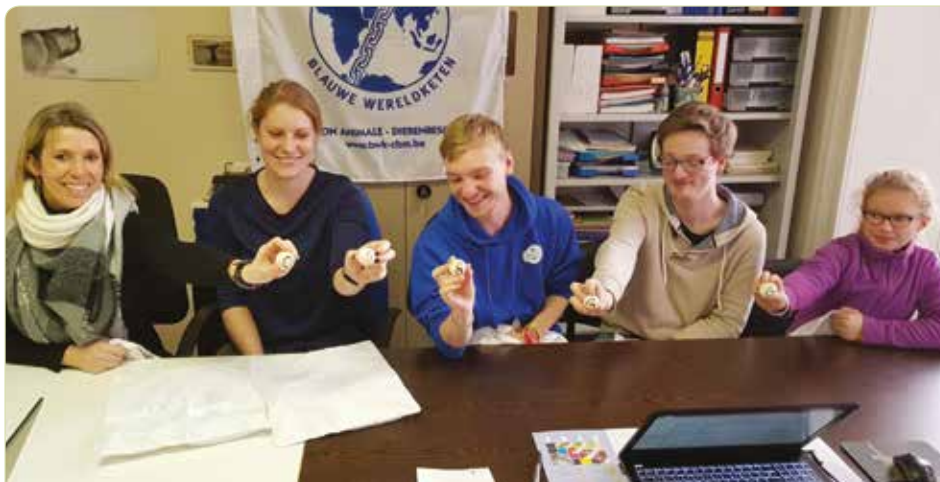
Het BWK-team trekt het winnend nummer van de hoofdprijs tombola 2017!

U mag heel binnenkort meer nieuws hieromtrent verwachten.